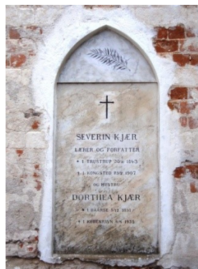
Mindeplade på Kongsted kirkemur