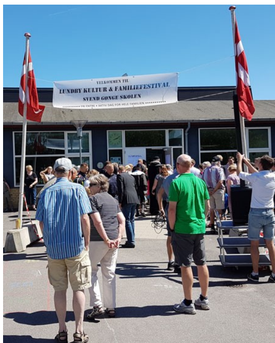
Her ved festivallens åbning i 2018.