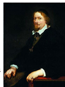
Corfitz Ulfeldt forhandlede som svensk hovedforhandler mod Danmark.

Arrangementet i Roskilde gennemføres i et samarbejde mellem Foreningen Svend Gønge, Roskilde Domkirke, Roskilde Kloster, Roskilde Museum og turistbureauet på torvedagen i børnenes vinterferie. Så der vil være