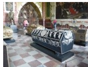
Chr. IVs sarkofag i Domkirken.