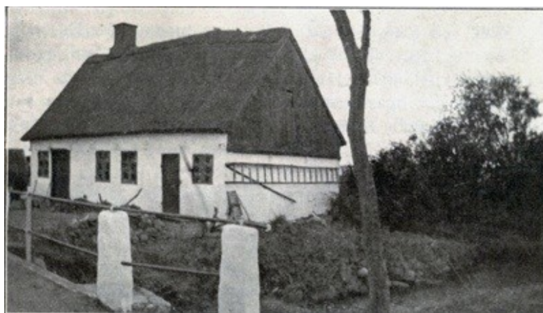
Vildtbanekroen ved Kyllebækkens udløb.