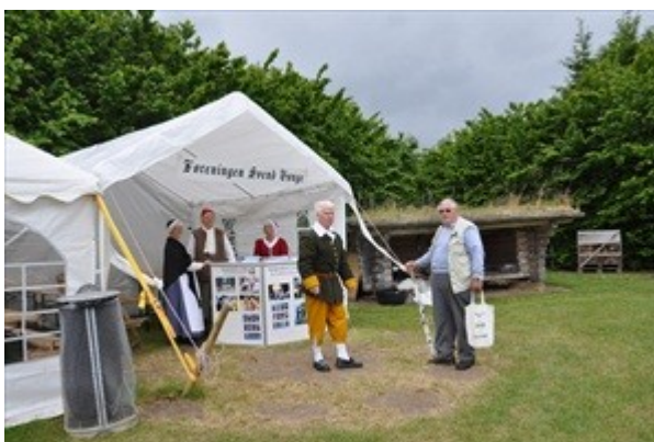
Gøgeboden på Festivalpladsen.

Festivalen blev afholdt på en meget dejlig plet, hvor kulsvierne har en flot bjælkehytte og et par shelters. Desuden var der en del telte med boder, hvor der blev solgt forskellige slags husflid - meget af det var kopier af gamle smykker, håndfarvet og plantefarvet garn, håndsmedede lysestager og pileflet. Og så var der mulighed for at købe flæskepandekager med tyttebærsyltetøj, ristede pølser og fadøl samt kaffe og kage.