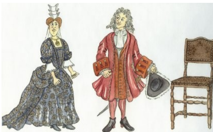
Tegning af barok dragt.