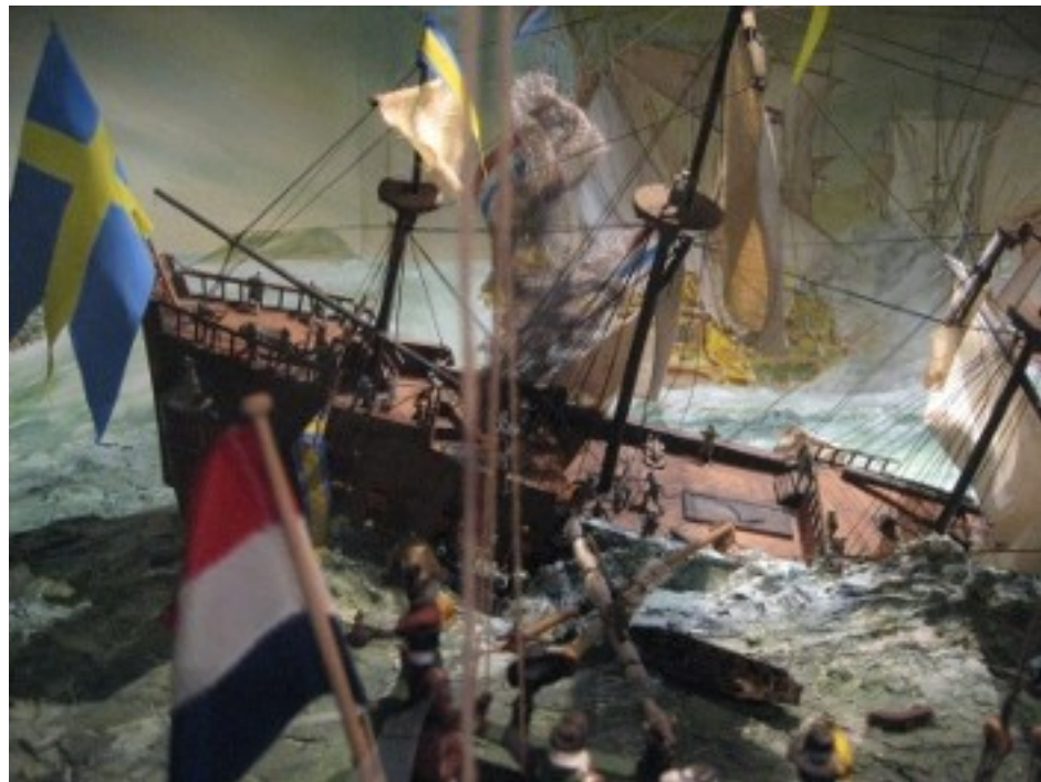
Svensk skibbrud i Øresund