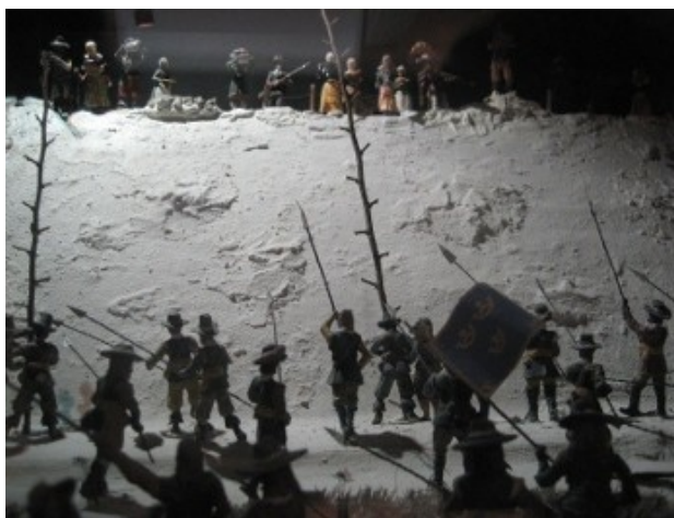
Stormløb på Københavns volde, foto fra diorama på Brønshøj Museum

Mange børnerige familier og alle skolelærere kender til den klassiske konflikt. To børn skændes om, hvem der begyndte. Argumenter flyver rundt, som svaler i sommerluften. Men planen ligger klar. Den ene vil opnå noget, der endnu ikke tidligere er aftalt.