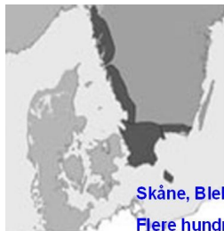
Skåne, Blekinge, Halland og Danmark Flere hundrede år fælles historie

Kuriøst nok findes stadig et lille antal ”svenske medborgere”, som bruger et skånsk flag.