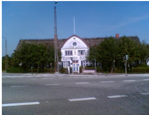
Rønnede Kro juni 2009