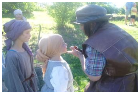
Kultur, traditioner og sprog ligner hinanden

At der i Sverige og eksisterer en stærk bevidsthed for dette er interessant.