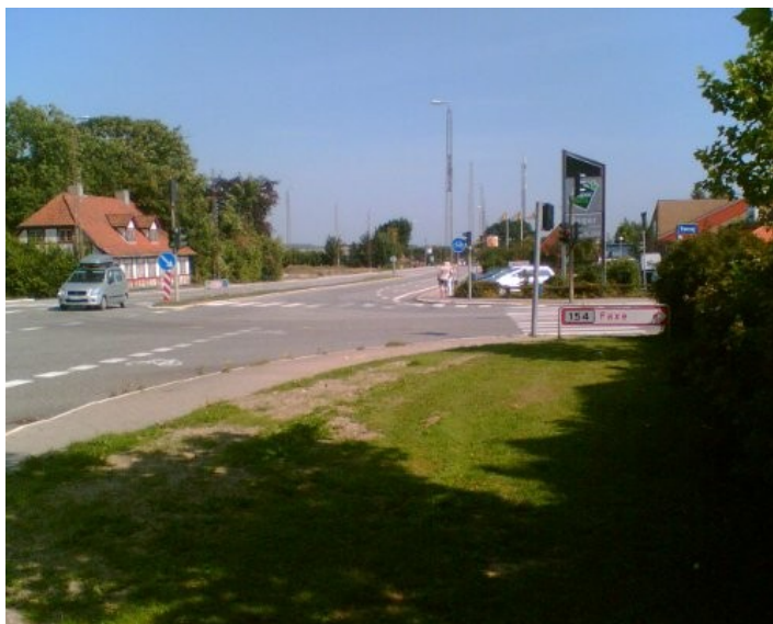
Vejkrydset i Rønnede juni 2009

flyttet til Rønnede, hvorfor privilegiet flyttede med. Vi skal være opmærksomme på, at vejforløbet mellem København, ned over Sydsjælland og til Lolland var ganske anderledes end i dag. Da var Vindbyholt et "knudepunkt" på ruten og Vindbyholt Kro og egnen omkring blev berørt af Svenskekrigen.