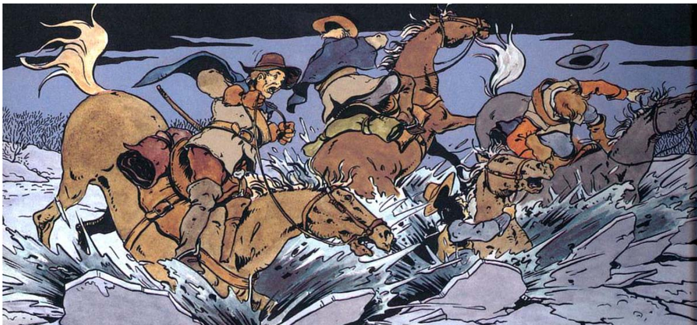
Illustration fra Orla Karlsens tegneserie om Gøngehøvdingen.