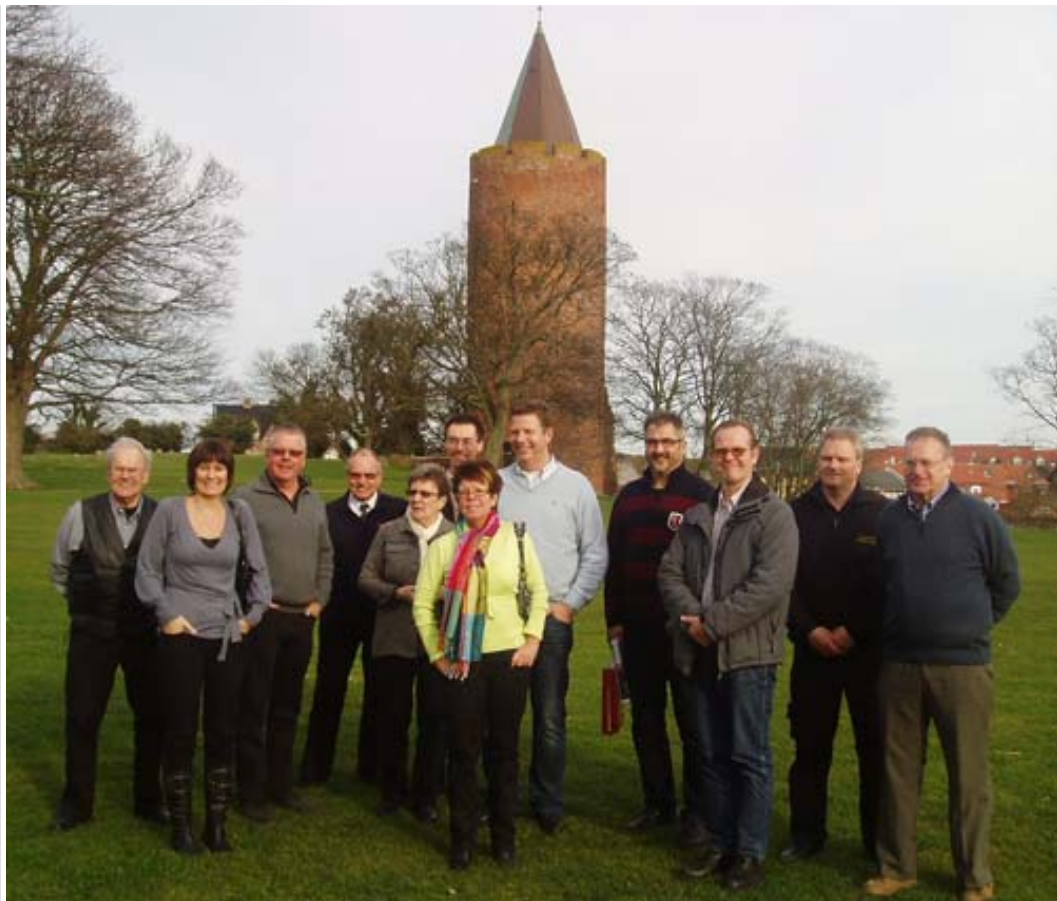
De 15 snaphaner fra Lönsboda besøgte naturligvis også Vordingborg, her foran gåsetårnet.