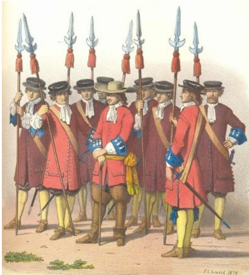
Drabantkorpsset på Christian 5.s tid (F.C. Lund 1870)