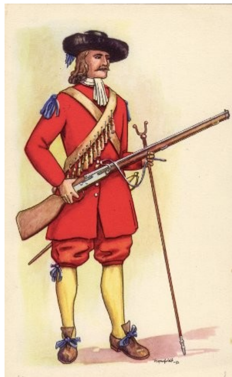
Musketer (geværskytte) af Den Kongelige Livgarde til Fods (Kongens Livregiment) ca. 1660 i regimentets karakteristiske røde uniform.