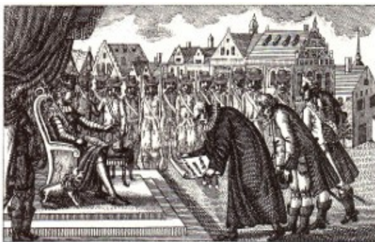
Anno MDCLX d. XVIII. Octbr.

Musketerer af Den Kongelige Livgarde til Fods (Kongens Livregiment) opstillet til sikring af tronen, mens stændernes repræsentanter kommer for at aflægge troskabseden til Kong Frederik 3 ved Arvehyldningen den 18. oktober 1660 på pladsen mellem Børsen og Københavns Slot. (Samtidig stik, Det Kongelige Bibliotek).