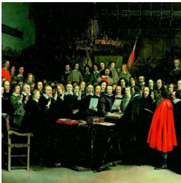
Fredsslutning af krigene.

I 1630 landede den krigsvante svenske hær i Pommern, og der blev sluttet forbund med Sachsen og Brandenburg, mens Frankrig og Nederlandene lovede at støtte økonomisk. Året efter blev Tilly i spidsen for kejserens og Ligaens forenede hære slået i Slaget ved Breitenfeld. I et dristigt felttog fik svenskerne nu kontrol med det meste af Tyskland, Rhinen blev krydset, og det svenske hovedkvarter valgte at slå sig ned i Mainz. Under den svenske invasion i Bayern faldt Tilly. Mod den svenske hær, som efterhånden var blevet mangedoblet ved hjælp af tyske og skotske lejetropper, betalt af de allierede og af skat og told fra de besatte områder, lod kejseren Wallenstein rejse en ny hær på 100.000 mand. Hovedstyrkerne mødtes i Slaget ved Lützen i 1632, hvorunder Gustav 2. Adolf faldt. Den svenske magt i Tyskland blev dog ikke rokket, og krigsførelsen fortsatte under rigskansler Axel Oxenstiernas ledelse. I 1634 blev Wallenstein myrdet på kejserens ordre, og Ferdinand 3. (kejser fra 1637) overtog hærledelsen; sammen med Spanien lykkedes det at sejre ved Nördlingen i 1634. Gradvist blev svenskerne herefter trængt tilbage mod Østersøen, og i 1635 blev Pragerfreden mellem Sachsen og kejseren indgået; den begrænsede Restitutionsediktet til at gælde i de lande, som kejseren havde kontrolleret i 1627, og gav Sachsen det omstridte land Lausitz.