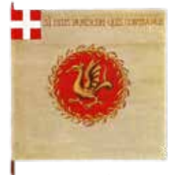
Fyenske Kompagnis fane 1657.