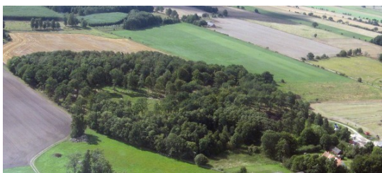
1600-talsparken i Ö. Sallerup.