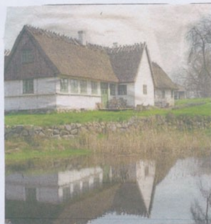
Gården »Skovly« i Kragevig, Foto: Privat