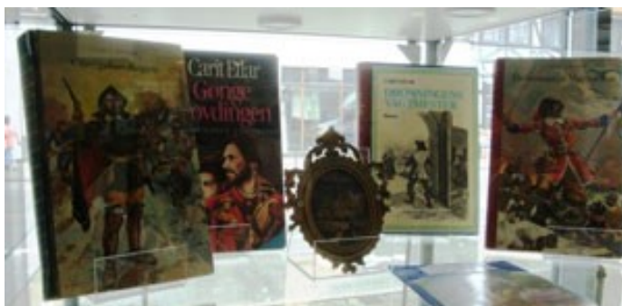
Udstilling af Gøngebøger på biblioteket