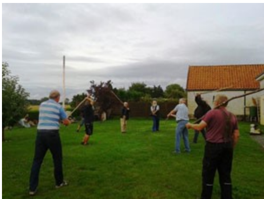
Der var trænet ihærdigt hjemmefra i Lundby...

Om søndagen optrådte FSG med et par scener fra "Gøngehøvdingen". Manheimer og Tange spillede terninger, hvilket I jo alle er bekendt med - det går helt galt. Tange taber alle sine sølvknapper, som han har fået af sin kæreste. Senere afslører Kulsoen gøngerne til nogle svenske Carolinske soldater. Det kommer til vældigt slagsmål, men Carolinerne bliver jaget på flugt!