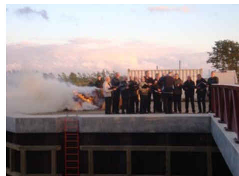
Rapsbålet afsluttede søndagen og dermed Gyldne Dage.