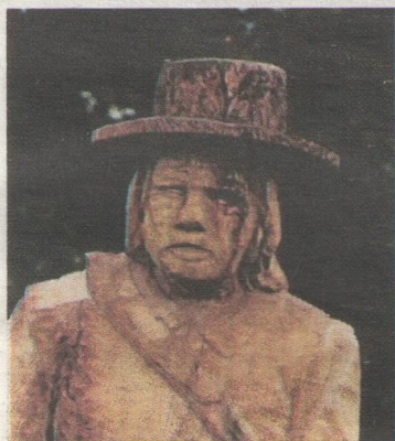
Göingehövdingen i Verum.