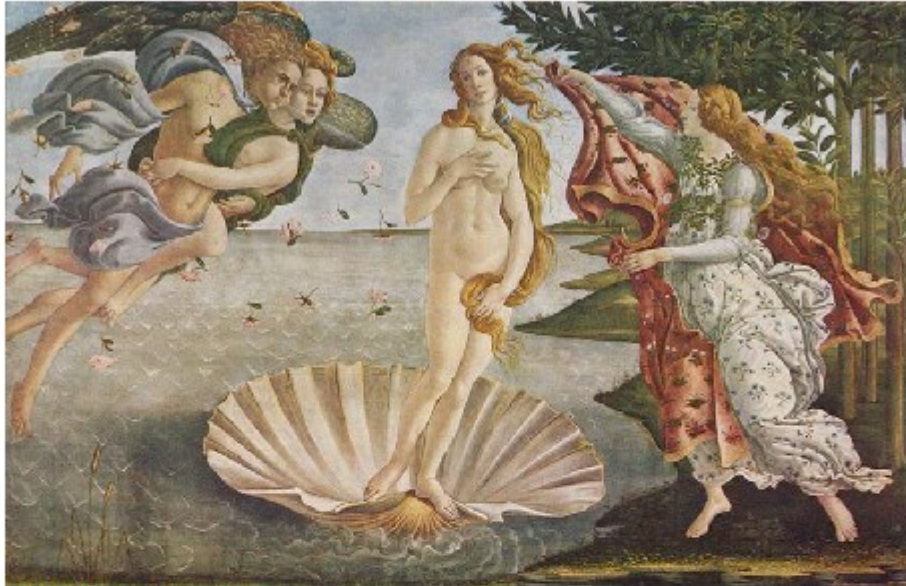
Sandro Botticelli, Venus födelse, ca 1485.