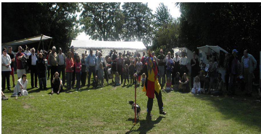
Gjønghundene gjorde stor lykke med deres hundekunster.

opvisning, lige fra gønghundekunster til renæssancedans og fægteopvisning.