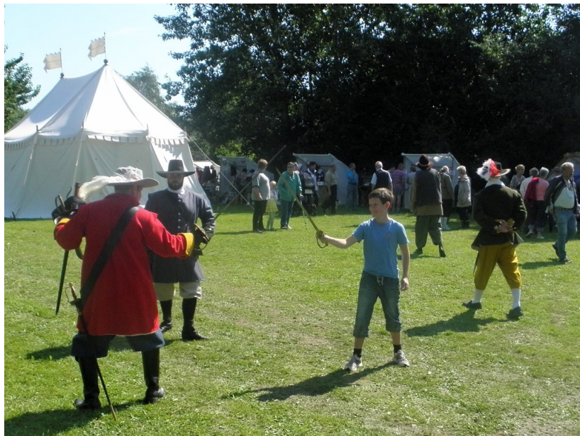
Kongens drabanter gav opvisning i fægtekunst og lærte fra sig til markedets yngre gæster.