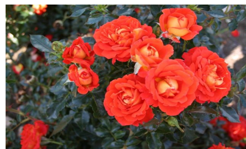
Svend Gønge rose