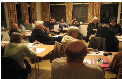
Vel besøgt generalforsamling 2010