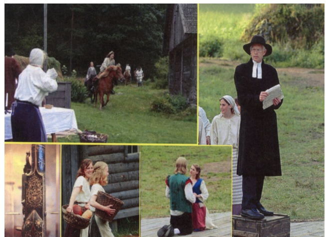
FSG deltager også selv i Skåne ved de mange arrangementer