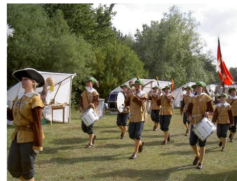
Gønge Garden ved Gønge Marked 2010