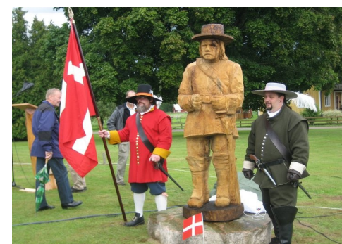
FSG deltager ved afsløring af statue i Verum, Skåne

Men kender du historisk interesserede, og har disse gode venner adgang til pc, er det jo lige for at anbefale et gratis medlemskab af FSG.