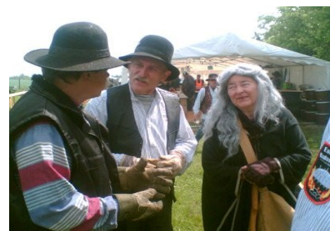
Svenske kolare og Kulsoen er på Kulsvier Festival