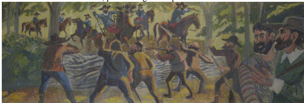
Overfald i skoven. Billedet hænger på Brøderup Ungdomsskole

Københavns borgmester får af kongens til opgave at finde en troværdig person som kan bringe en stor pengesum til København. Hvem andre end Svend og Ib kan det blive. Lyssky personer vil også gerne have de rare penge, og transporten giver Svend og Ib store problemer. Hvordan det går, kan man komme ud at se, når Friluftsscenen i Stevns Gymnastik og Idrætsefterskoles parkanlæg opfører forestillingen. Scenen opbygges helt anderledes end tidligere år. Denne gang tages volden bag scenen med i kulissen og selvfølgelig skal der også være heste med – datidens transportmiddel. På scenen vil der medvirke omkring 40 personer, men alt i alt kommer antallet, der på hver sin måde har medvirket, på omkring 60-65 personer.