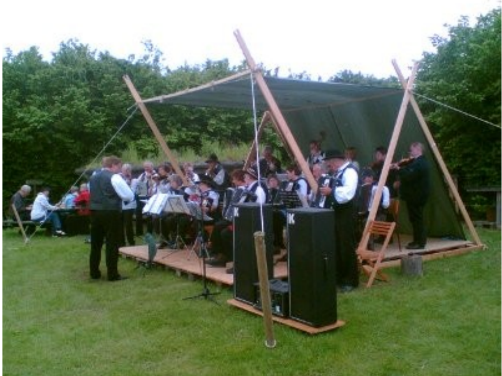
De Dysted Spillemand