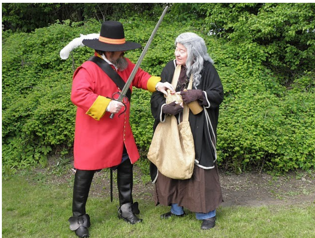
Mød Kulsoen på årets Gøngemarked