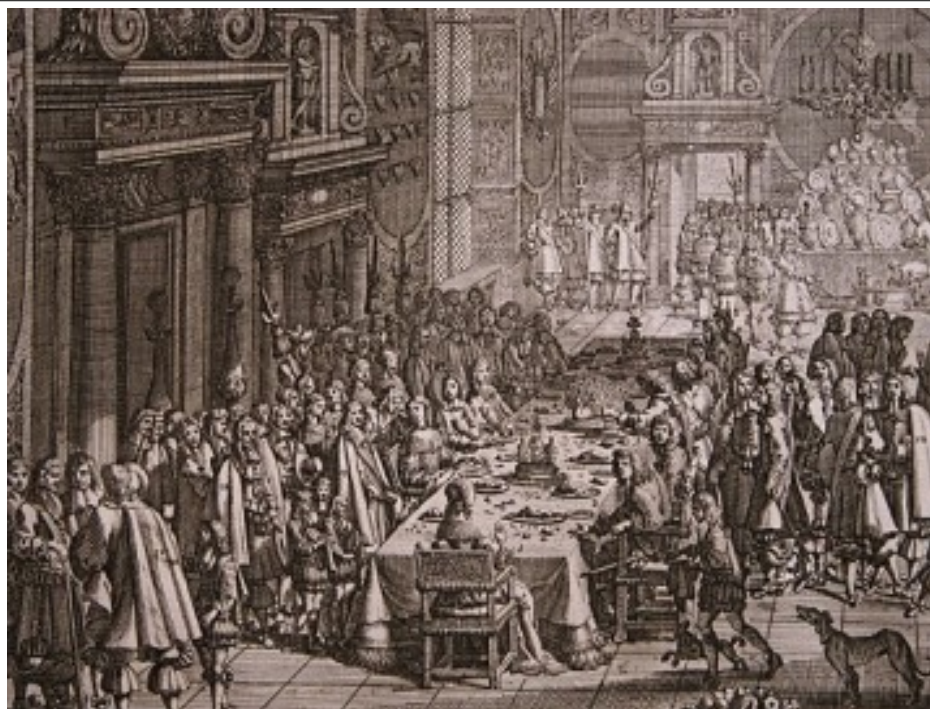
Fredstaffel på Frederiksborg Slot 1658 efter Roskildefreden.