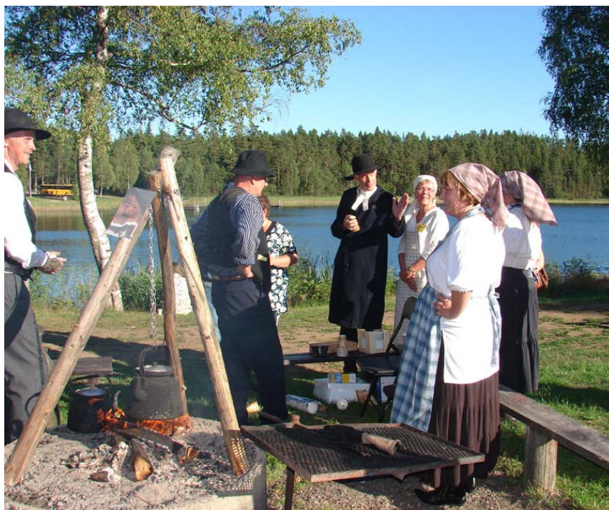
Sceneri fra snaphanemarkedet i Lönsboda i sommer. Lignende kan opleves i Lundby.

Et kapitel for sig er gæsterne fra Skåne, som blandt andet stiller med en knivhåndværker og stenovnsbagt brød.