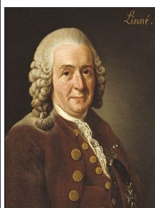
Carl von Linné

Den mere end 4.000-årige bondekultur kom til at blive devalueret af industrialisme, modernisme og velfærdsstatens bygherrer. Carl von Linnés naturlige voksne, og ofte i 1740'erne, smukt beskrevne landlige kultur, med dens respekt for alle naturlige sammenhænge, blev revurderet i/fra fremkomsten af industrialismen.