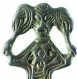
Gudinden Freja vrider sit hår

Vi kan tale om præ-kristne hellige miljøer. Det er kendt, at visse naturformationer og naturlige miljøer, kom til at blive separeret i religiøse aktiviteter. Vi ved også, at nogle moser, søer og vandløb indgår i de præ-kristne ritualer, og offerkult, som var en vigtig del af tidens fantasi. Vi har her antaget, at ødemark- og vintergudinden Skedja, i dette historiske danske miljø, har haft tilholdssted i Göinge, da Göinge havde / har mere kontinentale klima, vinter, og større vildnis end resten af Danmark. Vintergudinden er et sæsonbestemt aspekt af den mere berømte gudinde af frugtbarhed og sommerskønhed, Moder Jord - Freya Vanadis. - Gaja - Vardigoia - Gydja -?