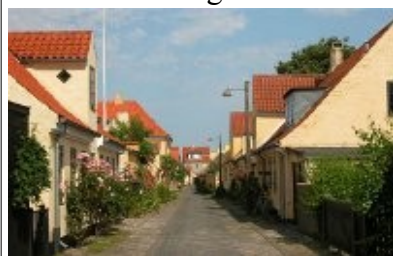
Bybillede af Dragør i dag

Det var kun meget få beboere i Dragør, der havde en ko, for man havde jo ingen jord til græsning og måtte derfor købe græsningsret hos de to gårdmænd i byen.