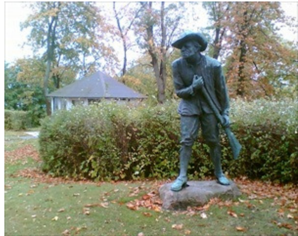
Friskyttens Lille Mads

Hjertebånd kan købes i boghandlerne, samt på www.antikvariat.net