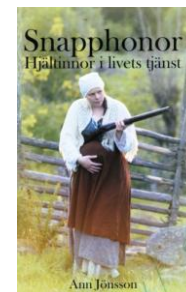
Snaphonor af Ann Jönsson Oversat af FSG

Foreningen sælger følgende bøger, som kan bestilles via hjemmesiden: