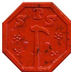
Svend Poulsens segl