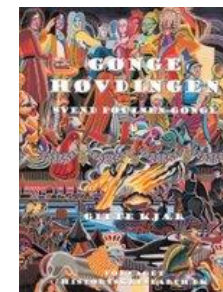
Gøngehøvdingen Svend Poulsen Gønge af Gitte Kjær